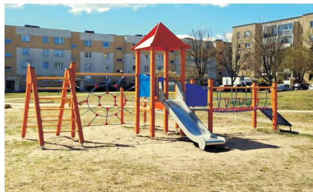
foto. nowy zestaw zabawowy przy ul. Gdańskiej 22-24

Członkowie komisji przetargowej, w skład której wchodziła członkowie Rady Nadzorczej, na podstawie porównania oraz indywidualnych ocen ofert, zgodnie z kryteriami określonymi w specyfikacji istotnych warunków zamówienia,