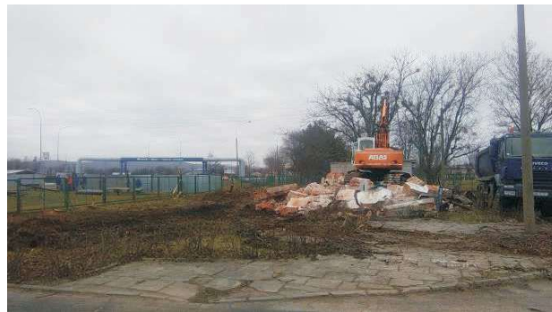
Aktualnie przygotowany jest teren pod budowę pierwszego budynku

W związku z otrzymanym pozwoleniem na budowę Spółdzielnia rozpoczęła kolejne przedsięwzięcie z zakresu budownictwa mieszkaniowego. Inwestycja realizowana jest przy ul. Dąbrowskiego, na terenach, na których zlokalizowane jest biuro administracji – a więc z dala od spółdzielczych budynków.