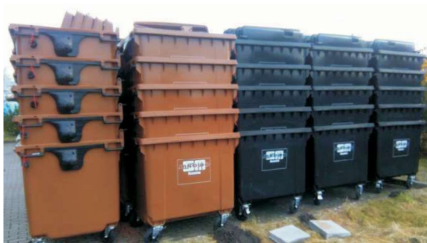
Nowe pojemniki już wkrótce staną w osiedlowych pergolach

Jak pisaliśmy, dotychczasowa wysokość opłaty z tytułu dzierżawy pojemników nie wzrośnie , jedynie zostanie zmieniona nazwa tej pozycji na „opłatę za pojemniki”. Obejmie ona koszty konserwacji/naprawy pojemników, ich dezynfekcji, ubezpieczenia oraz sukcesywny zwrot