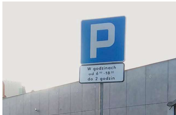
Obowiązują już tam nowe zasady parkowania

Z uwagi na to, że od dawna w rejonie pawilonu istniały problemy z parkowaniem samochodów (miejsca były zajmowane przez pracowników i klientów okolicznych firm), Spółdzielnia zdecydowała o wykonaniu dodatkowych miejsc postojowych przed pawilonem. Z parkingu można korzystać, ale należy pamiętać, że postój przed pawilonem