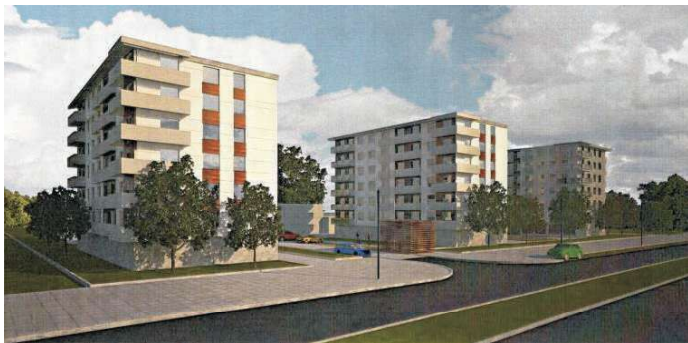
Przy ul. Dąbrowskiego staną trzy budynki mieszkalne

W związku z otrzymanym pozwoleniem na budowę Spółdzielnia rozpoczęła kolejne przedsięwzięcie z zakresu budownictwa mieszkaniowego. Inwestycja realizowana jest przy ul. Dąbrowskiego, na terenach, na których zlokalizowane jest biuro administracji – a więc z dala od spółdzielczych budynków.