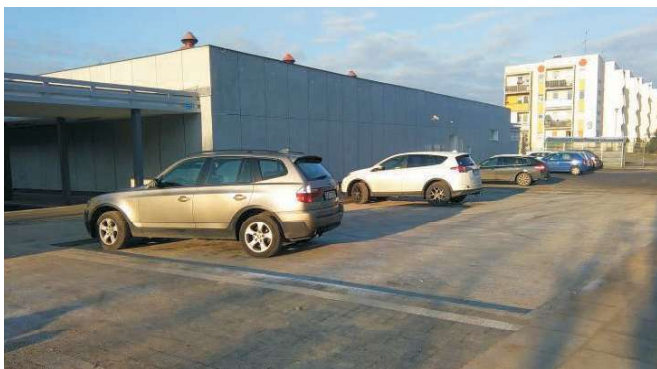
Przy pawilonie dodatkowo powstał parking, a także wykonywane są chodniki

Zakończyły się prace związane z modernizacją zarówno pawilonu przy ul. Stoczniovców 7, jak i jego patio, gdzie wykonano prace brukarskie i zasadzono zieleń.