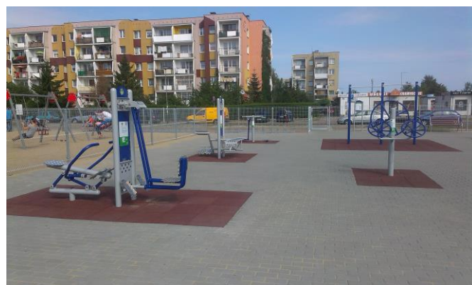
można już korzystać też z siłowni zewnętrznej

Został on podzielony na dwie części: w większej z nich znalazły się nowoczesne, atrakcyjne urządzenia zabawowe dla najmłodszych w „stylu” kosmicznym, w mniejszej natomiast postawione zostały urządzenia do ćwiczeń.