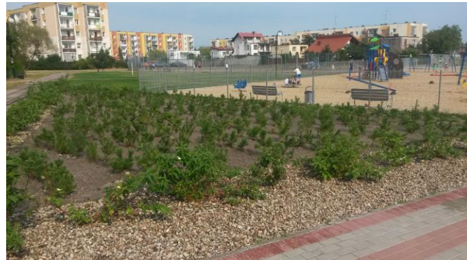
i przy placu zabaw na jednostce E

Przeprowadzone prace to efekt uchwały Rady Nadzorczej, która została podjęta w maju tego roku. Sama uchwała to efekt