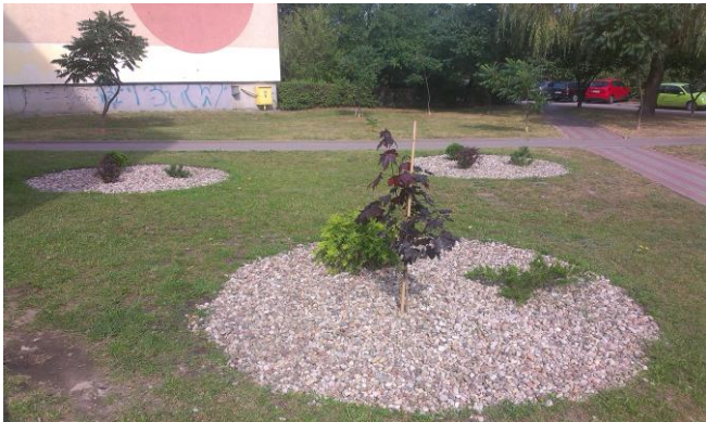
Nasadzenia przy Dąbrowskiego 52-Stoczniowców 11

Jak pisaliśmy, tuż przed rozpoczęciem wakacji rozpoczęły się nasadzenia na terenie osiedla. Nasadzenia te powstały w siedmiu lokalizacjach – w okolicach Dąbrowskiego 52, Gdańskiej 8, 28 i 31, Pomorskiej 1, 19 i 29. W każdej z nich powstało po kilka skupisk zieleni. Zasadzono w nich tuje, cyprysy, rajskie jabłonie, kosodrzewinę, jałowce, tawuły, berberysy czy sosny ozdobne. Przy wyborze poszczególnych kompozycji uwzględniony był nie tylko efekt estetyczny, ale także koszt nasadzeń i ich przyszłej pielęgnacji.