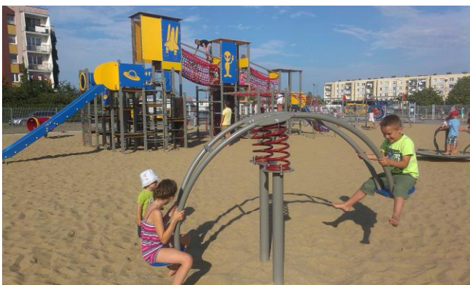
Nowy plac zabaw cieszy się powodzeniem

Pod koniec pierwszej połowy sierpnia – od razu po zakończeniu prac – uruchomiony został plac zabaw wraz z siłownią zewnętrzną w pobliżu budynków Gdańska 33 i 37 oraz Wrocławska 28. Nowo powstały teren rekreacyjny jest nieco odmienny od tego, który powstał w ubiegłym roku na terenie jednostki E.